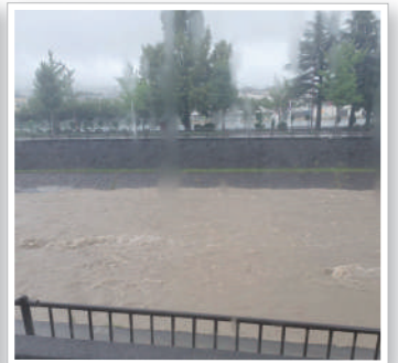
水無川の強い流れ