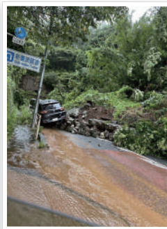
国道246のトンネル崩壊(伊勢原市)