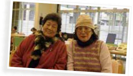
サバティのベテラン仲良し2人組。 ステキです。