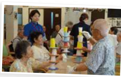
誰が一番高く積み上げられるのかな〜