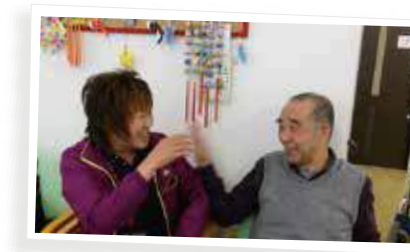
なんか、いちゃいちゃしてませんか？ いやスキンシップですね