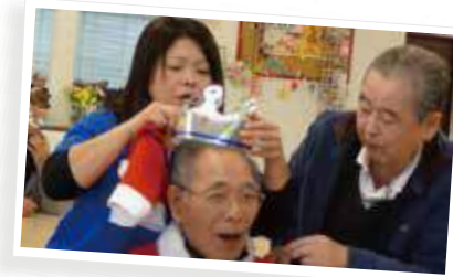
悪ふざけが過ぎて、 周りの人が楽しんじゃってますね