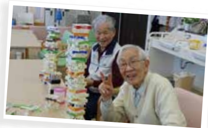
すごい記録が出ましたね〜 まだいけそうですかー