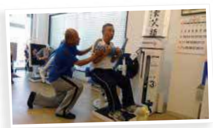
サバティのトレーナーって熱血でしょ。 かっこいい〜…かな？