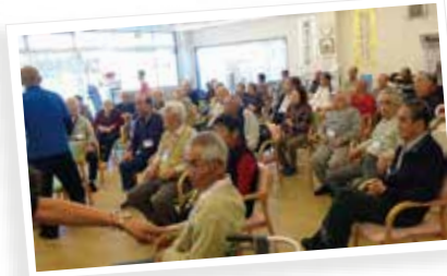
満員御礼!いつもありがとうございます〜す