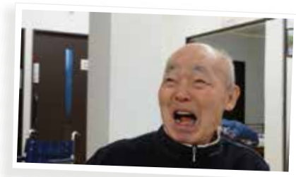
な、何があったんですか!