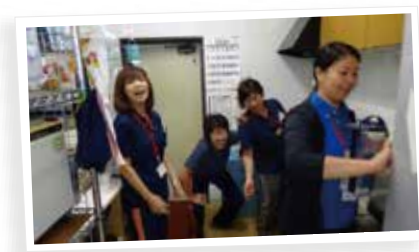
こんなスタッフ達が サバティを支えてくれていま〜す