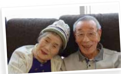
なんかいい感じじゃないですか？ ちょっとジェラシー

毎年恒例となった〇周年。早いもので今月からいよいよ5年目に入ります。オープン当初から、来て頂いているご利用者様から最近来られるようになったご利用者様、60才代の方から高齢者（サバティでは90才超えないと言われません（笑））のご利用者様まで、幅広いご利用者様が来て頂いています。そんなご利用者様同士が、冗談を言ったり、はしゃいでたり（失礼ですが（笑））、まるで小学校の同級生同士のようなお付き合いをされている様子を見て、サバティのご利用者様って最高だなあ〜って思います。いつまでも来て下さいね。