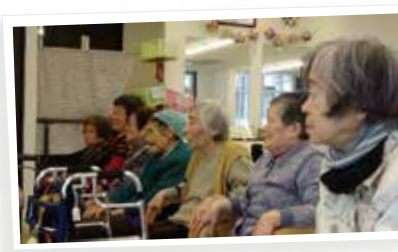
女性ご利用者様です。 この眼差しの向こうには何があるのでしょうか