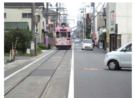
この状況で右に車線変更して回避します