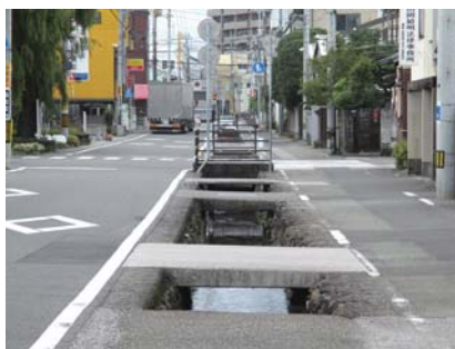
柵も何もないのが凄い。 軽自動車は何回か落ちてるのを見たとの 目撃証言がありました。