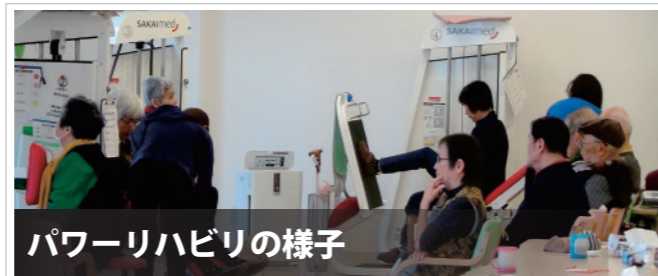
パワーリハビリの様子