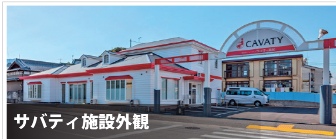
サバティ施設外観