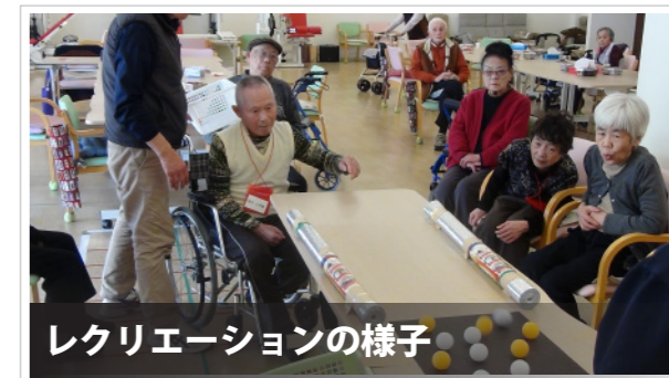
レクリエーションの様子