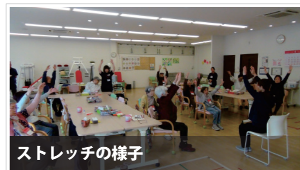
ストレッチの様子

数年前から、両膝や腰が痛くて歩くのも嫌になっていました。気持ちも沈んでしまってどうしようもなかった時期にサバティに通うようになって、 気持ちが明るくなりました。 軽い重さの運動なので、体も痛く無く安心です。気持ちが前向きになると体も以前よりは良くなったように感じます。今ではサバティに来ることが一番楽しみです。